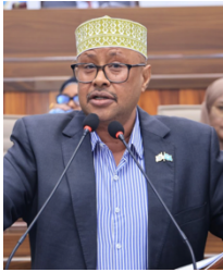
Sen. Abdikani Gelle Mohamed

Qodobka 93aad farqadda seddaxaad go’aanada kulamada wadajirka ah aqlabiyad cod dheeri ah ee goob jooga labada gole waxaa lagu daray hoos kasii baa kujirta, haddii dastuurka si kale u arko “side u arki karaa dastuurka?” Halaga saaro middaas haku caddaato caqlabiyada saas ayay ku egtahay go’aanada labada gole ee wadajirka ah caqlabiyad cod dheeri ah ayaa lagu kala qadanaya inta goob jooga ah, haddii haddiidaas maxaa waaye? Oo shaki baa la gelinayaa marka dastuurka waa in uu cadaaddaa “No” hoos kasii aad iyo aad ayaad u mahadsantihiiin.