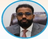
Sen. Ali Shacban Ibrahim Guddoomiye Kuxigeenka 1aad Aqalka Sare