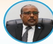
Sen. Abdullahi Ali Hirsi Guddoomiye Kuxigeenka 2aad Aqalka Sare