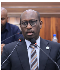
Sen. Abdihakim Moalim Ahmed

Bismillahi Alraxmani Alraxiimi, Alxamdullailahi Rabil caalamiin wasaalatu wasaaalam calaa rasuullilahi.