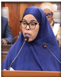
Sen. Deka Hassan Hussien

Arrimaha jadwalka aniga aad maba u fahminba, waa isku dhax fiirinay inta badan meelo badan oo isku soo laa labanayo ayaa ka jira guddigu waxaa ka cod saneynaa in uu kala soo saaro jadwalka sida hadda shaqaalaha, caafimaadka, awoodaha kaluumeysiga iyo kheyraadka, awoodo badan oo jadwalada labada dhinacba ku jira, marna wadaag noqonaya marna gaar u kala yeelanayaan ayaa qoran marka in lakala saaro, waxaa kaloo ka codsanayaa in la soo koobo nuxurka dastuurka, maadaama fisiraad uu yelanaayo oo xeerar ay ka fisirmayaan, in nuxur yaroo kooban oo la fahmi karo laga soo dhigo aad iyo aad ayaad u mahadsantihiin.