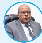
Sen. Abdullahi Ali Hirsi Guddoomiye Kuxigeenka 2aad Aqalka Sare