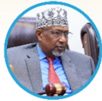
Xil. Sh. Adan Mohamed Nur (Madoobe) Guddoomiyaha Golaha Shacabka