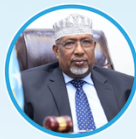
Xil. Sh. Adan Mohamed Nur (Madoobe) Guddoomiyaha Golaha Shacabka