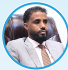
Sen. Ali Shacban Ibrahim Guddoomiye Kuxigeenka 1aad Aqalka Sare