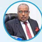
Sen. Abdullahi Ali Hirsi Guddoomiye Kuxigeenka 2aad Aqalka Sare