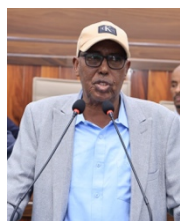
Sen. Ahmed Mohamed Ali

Cutubka 13 aad qodobkiisa oo ka hadlaaya qodobada guud, qodobka 188 habraacyada wax ka beddelka distoorka faqrada 2 aad waxaan xoojinayaa oo anigu codkayga ku biirinayaa qaababka wax looga beddelayo dadka soojeedinaya markii laga hadlaayey xarafka (d) waxa la qoray ugu yaraan 150,000 oo codbixiyayaala oo diwaangashani inay soojeedinta ka qaybqaadan karaan ama ay soojeedin karaan distoorka wax kamida in la beddelo. Waxaan anuu soo jeedinayaa 15,000 kaliya laga dhigo halka 150,000 ka tahay ee dadweynaha codbixiyayaasha ah waa in 15,000 lagu soo koobo faahfaahintana xildhibaanadii iga horeey baa sheegay markaa tirada 150,000 aad bay u badan tahay 15,000 halaga dhigo, intaas ayaan anigu ku soo gaabinayaa, aad iyo aad ayaa u mahadsantihiin, salaamu calaykum waraxma tulaah.