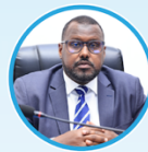
Xil. Abdullahi Omar Abshir Guddoomiye Kuxigeenka 2aad Golaha Shacabka