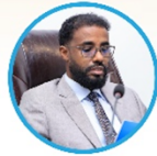
Sen. Ali Shacban Ibrahim Guddoomiye Kuxigeenka 1aad Aqalka Sare