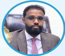
Sen. Ali Shacban Ibrahim Guddoomiye Kuxigeenka 1aad Aqalka Sare